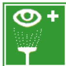
E 09 Augenspüleinrichtung