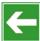
E 13 Richtungspfeil

Nur in Verbindung mit Zeichen E 06 bis E 16 zulässig