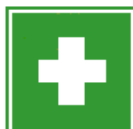
E 06 Erste Hilfe