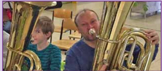
Blasorchester-Projekte für alle Altersgruppen