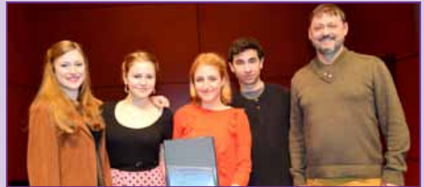
Schülerinnen bei Jugend musiziert erfolgreich