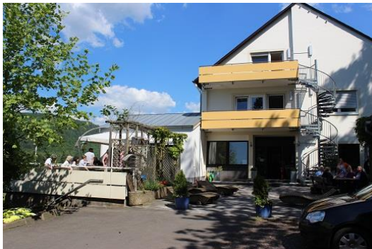
(GPBZ Haus Felsenburg)