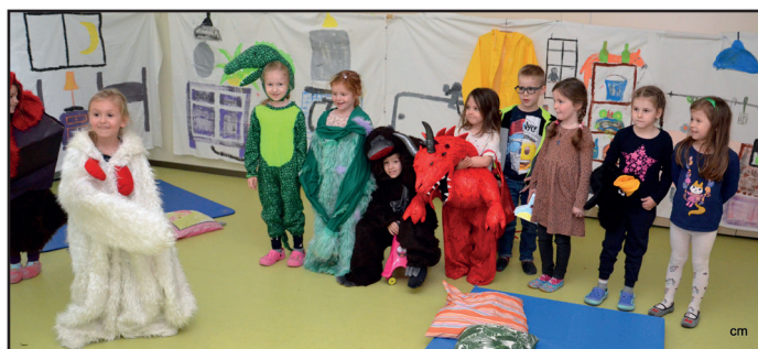
... und auf Taschenlampen-Reise in der Nacht („Wir haben doch keine Angst im Dunkeln“)