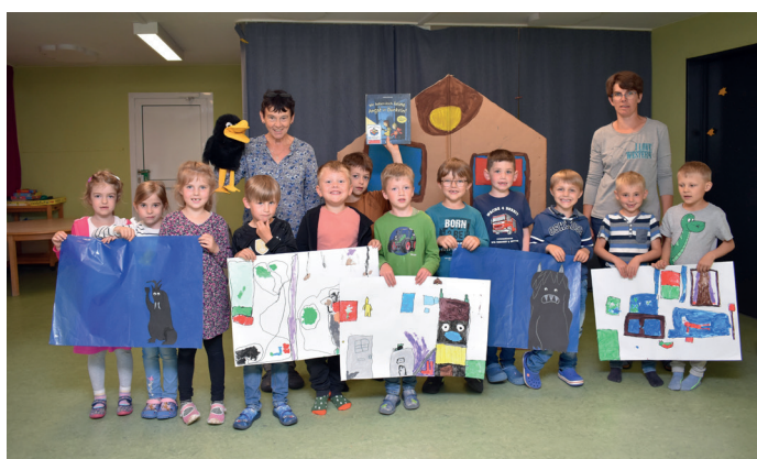
... und gruselige Monster in Greimerath.

ten sich Zuschauer und Darsteller anhand selbst gemalter Szenenbilder auf die Suche nach unheimlichen Monstern im Haus, die sich dann als völlig harmlose Alltagsgegenstände entpuppten.