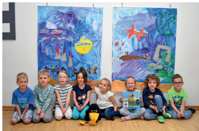
Wunderbare Unterwasserwelten Plein ...

In Greimerath ging es mit der Lieblingsgeschichte „Wir haben doch keine Angst im Dunkeln“ von Frederic Bértrand eher gruselig zu. Gemeinsam mit den Protagonisten mach-