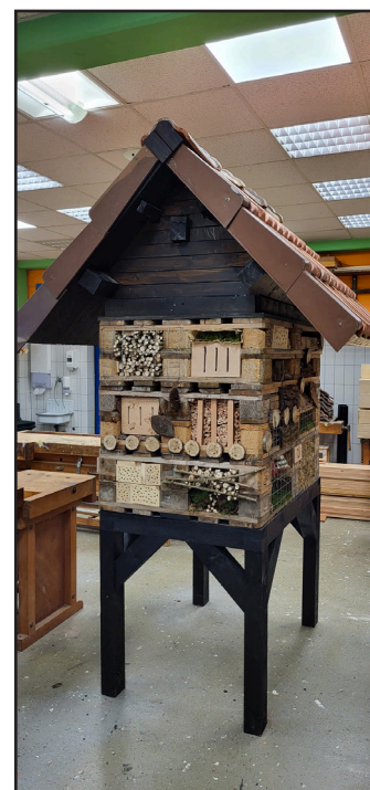
Insektenhotel als Projektarbeit aus dem Projekt „JobAction“

Das Projekt wird seit 2013 im ÜAZ-Wittlich durchgeführt. Hierbei werden Auszubildende als auch Betriebe in kritischen Ausbildungssituationen unterstützt. Zur Zielgruppe gehören Jugendliche und Erwachsene unter 30 Jahren, die sich in einer Ausbildung oder Einstiegsqualifizierung befinden und die so schwerwiegende Probleme in ihrem Ausbildungsbetrieb, in der Berufsbildenden Schule oder in ihrem sozialen Umfeld aufweisen, dass dies zu einem Ausbildungsabbruch führen könnte beziehungsweise, dass die Wahrscheinlichkeit gering ist, dass sich an eine Einstiegsqualifizierung ein reguläres Ausbildungsverhältnis anschließt. Ebenso sind auch Auszubildende angesprochen, die aus anderen Gründen beabsichtigen ihre Ausbildung abzubrechen oder deren Betrieb auf Grund wirtschaftlicher Schwierigkeiten die Ausbildung nicht fortsetzen kann. Zusätzlich wird das Projekt durch die Nikolaus Koch Stiftung gefördert. Die Nikolaus Koch Stiftung ist eine gemeinnützige Stiftung, die sich seit 1993 in den Bereichen Bildung und Hilfe für Menschen mit Behinderung in der Region Trier engagiert.