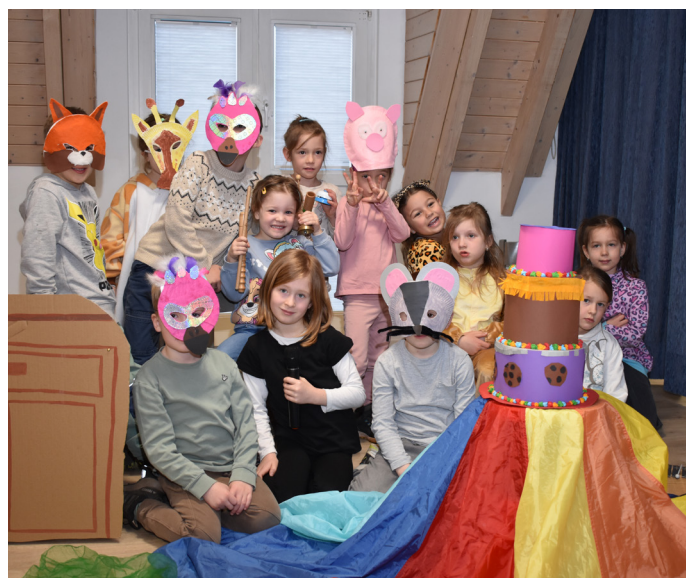
Schokotorte für die Kinder aus der Kita Bergweiler

Haben auch Sie eine Projektidee, die eine Bereicherung für die LEADER-Region Vulkaneifel sein könnte? Dann melden Sie sich gerne beim Regionalmanagement per E-Mail ( vulkaneifel@entra.de ) oder telefonisch (06302 9239-23) werktags zwischen 9:00 und 16:00 Uhr.