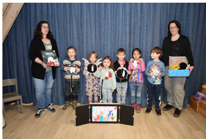
Helpfen gegen nächtliche Ängste: Traumfänger aus der Kita Plein

Die Kinder aus Plein hingegen setzten auf eine ruhige, kreative Umsetzung. Inspiriert von der Geschichte eines Gespenstes, das sich vor nächtlichen Geräuschen fürchtet und deshalb nicht schlafen kann, gestalteten sie kunstvolle Traumfänger. Darüber hinaus präsentierten sie im Kamishibai-Bildtheater eigene Ängste, die sie in ausdrucks-