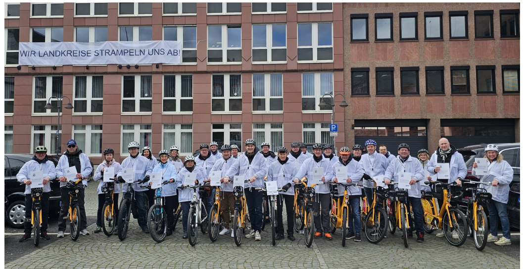
24 Landrätinnen und Landräte aus Rheinland-Pfalz haben in Mainz auf die angespannte Lage der Landkreise aufmerksam gemacht.

Zentral für die kommende Wahlperiode sind aus Sicht des Landkreistages eine Finanzausstattung, die es den Landkreisen erlaubt ihre Kernaufgaben zu erledigen. Eine Bildungspolitik, die fördert und fordert und eine wohnortnahe Gesundheitsversorgung. In allen Bereichen sehen sich die Landkreise mit stetig steigenden