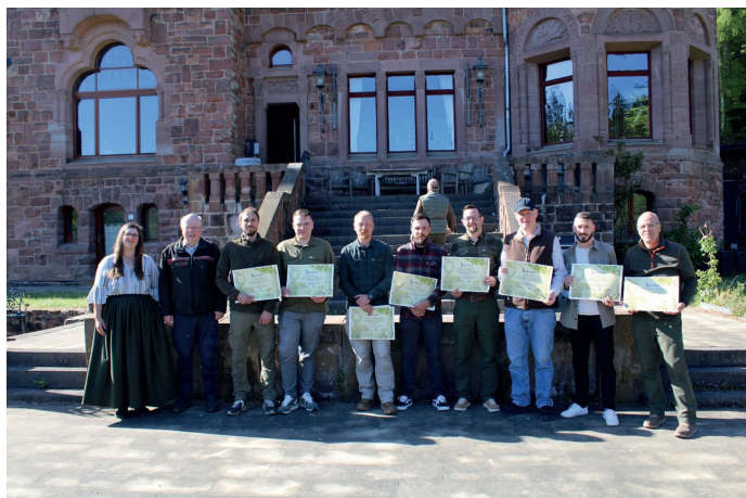
In einer Feierstunde im Schloss Bergfeld in Eisenschmitt erhielten acht Anwärter ihren Jagdbrief.