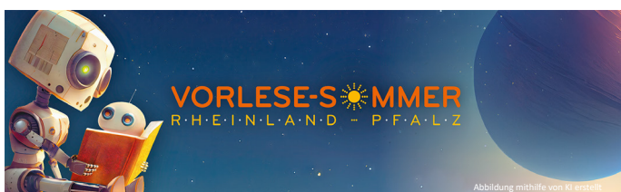
Abbildung mithilfe von KI erstellt.

Um möglichst viele Kinder zu erreichen, wurde der Link per Mail an die Kitas im Landkreis versendet. Das Bibliotheksteam freut sich auf einen heißen Vorlese-Sommer mit lustigen, spannenden und fantastischen Geschichten und zahlreichen Vorlese-Teams.