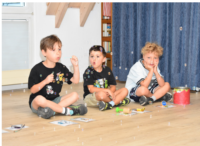
Blubbernde Seifenblasen-Pupse vom Wal

Im Rahmen des Projekts wählte jede teilnehmende Kita ein Lieblingsbuch aus und entwickelte hierzu eine eigene kreative Darbietung, die bei den gemeinsamen Treffen in der Bücherei präsentiert wurde. Die Kinder aus Mülheim entschieden sich für das humorvolle Bilderbuch „Nur noch