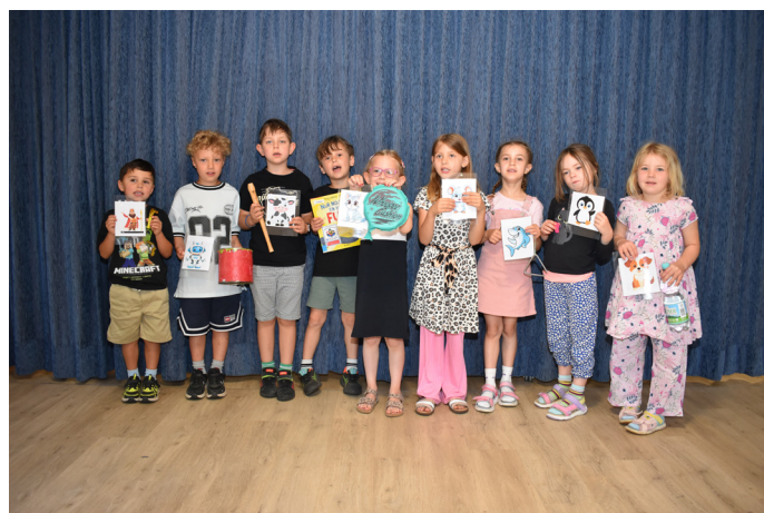
Das Mülheimer Wanderraben-Team mit seinem Lieblingsbuch

Donnerstag, 11. Juni 2026, 18:00 – 20:00 Uhr Kreisverwaltung Bernkastel-Wittlich Kurfürstenstraße 16, 54516 Wittlich