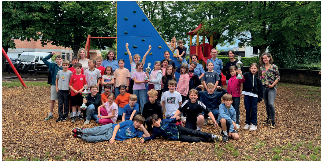
Die Schulklassen der Grundschulen mit ihren Klassenlehrerinnen sowie den gewonnenen Pokalen.

Mit viel Freude, großem Engagement und auch einer Portion Aufregung fand in Salmtal der diesjährige Kreisentscheid der Jugendverkehrsschulen statt. Im Mittelpunkt standen dabei nicht nur die Verkehrserziehung und das sichere Verhalten im Straßenverkehr, sondern auch der Teamgeist, der Zusammenhalt und die Begeisterung der Kinder. Die besten Teams der Grundschulen aus den Jugendverkehrsschulen Maring-Nowiand, Morbach und Salmtal-Dörbach kamen zusammen, um ihr Wissen und ihre Fähigkeiten rund um den Straßenverkehr unter Beweis zu stellen. In einer theoretischen und praktischen Prüfung zeigten die Schülerinnen und Schüler eindrucksvoll, wie sicher und